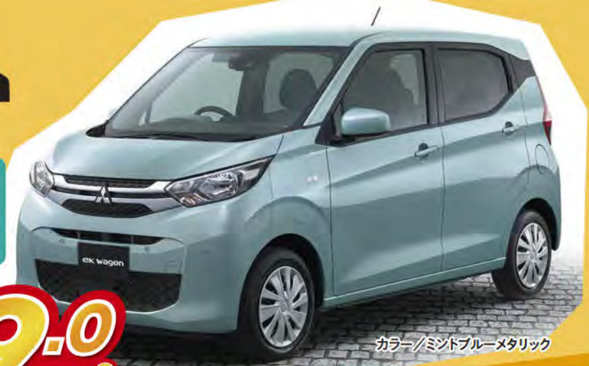
カラー/ミントブルーメタリック