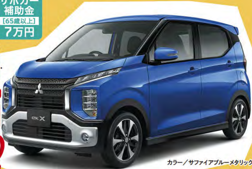
カラー/サファイアブルーメタリック