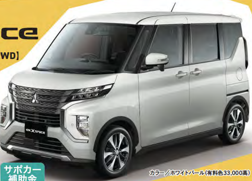
カラー/ホワイトパール(有料色33,000高)

車両本体価格 1,771,000円 純正7型ナビ 134,508円 合計 1,905,508円