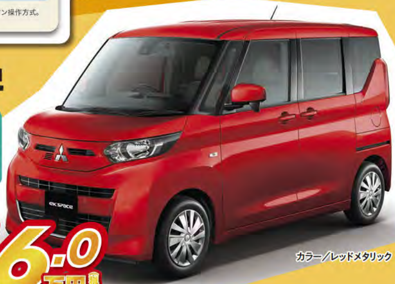
カラー/レッドメタリック